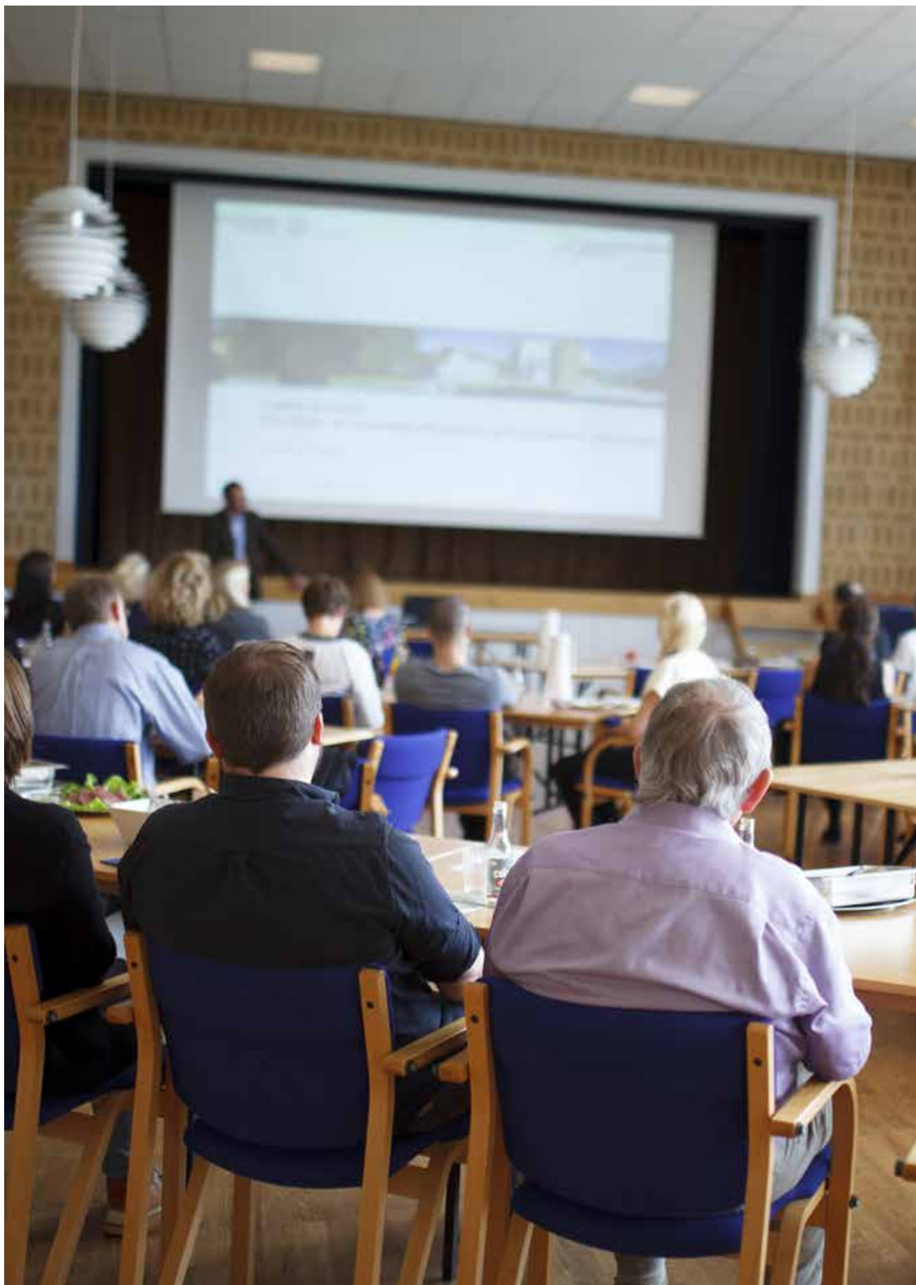
Formidling af forskningsresultater er en vigtig parameter for Psykiatrien i Region Nordjylland.